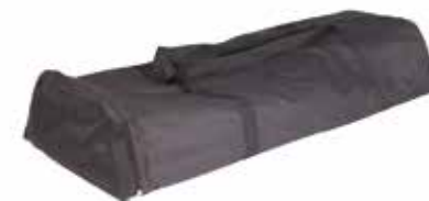
Sac de transport inclus