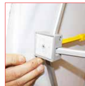
Fixation du visuel par velcro