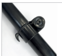
Fixation de la voile avec crochet