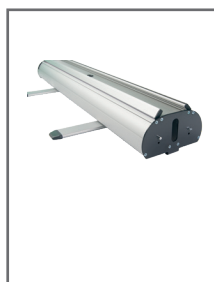
Carter avec pieds stabilisateurs

Les gabarits d'impression mis à disposition sont fournis à titre indicatif. Ils tiennent compte de procédés internes qui peuvent varier selon vos équipements, matières & finitions. En cas d'impression par vos soins, il vous appartient de tester au préalable la compatibilité de votre media avec le produit avant utilisation.