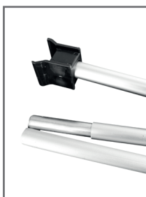
Mât élastique 3 parties